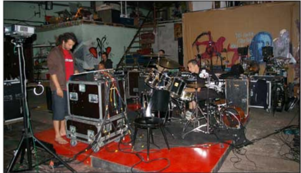
Les artistes répètent pour être au point le jour J / Photo Barbara Pelmard

albums. Le KomplexKapharnaüm, équipe villeurbannaise composée de vidéastes, plasticiens, écrivains et musiciens, prépare un assortiment de vidéos qui s'écriront sur les murs de la ville. En tout, 28 artistes réunis autour d'un même but : partager un bon moment avec le public. Au programme, un circuit déambulatoire d'1 h 30 qui partira de la place Lazare-Goujon. Un spectacle collaboratif, ensemble, mais aussi un spectacle auquel les Villeurbannais peuvent participer. A l'occasion du spectacle, les ateliers Frappaz recherchent des