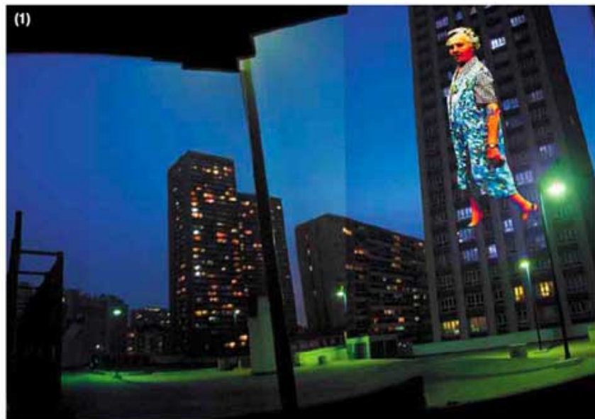
(1) Une vue d'artiste de l'installation vidéo proposée par la compagnie KompleXKapharnaüm . (2) Le collectif Les Souffleurs en pleine répétition avant sa représentation nocturne. (3) Le groupe ZUR se prépare à envahir la BNF. (4) Le cheval mécanique de la compagnie Le Phun .