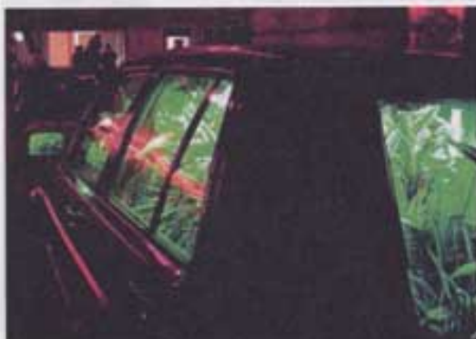
Maro Avrabou et Dimitri Xenakis.

Rue de Tolbiac, 13 e A la sortie du métro, attendez-vous à ce que d'épais nuages de fumée se mettent à sourdre des bouches d'égouts, éclairées de l'intérieur par les bons soins de la créatrice lumière Caty Olive . Ensuite pourront apparaître d'incongrus véhicules habités d'une végétation trop luxuriante pour être honnête et surlignée au tube fluorescent par Maro Avrabou et Dimitri Xenakis . Pour une présence humaine – ou presque –, ça se passe sur la dalle des Olympiades. Là, la compagnie KompleXKapharnaüm est allée, comme à sa bonne habitude, à la rencontre des riverains, pour en tirer